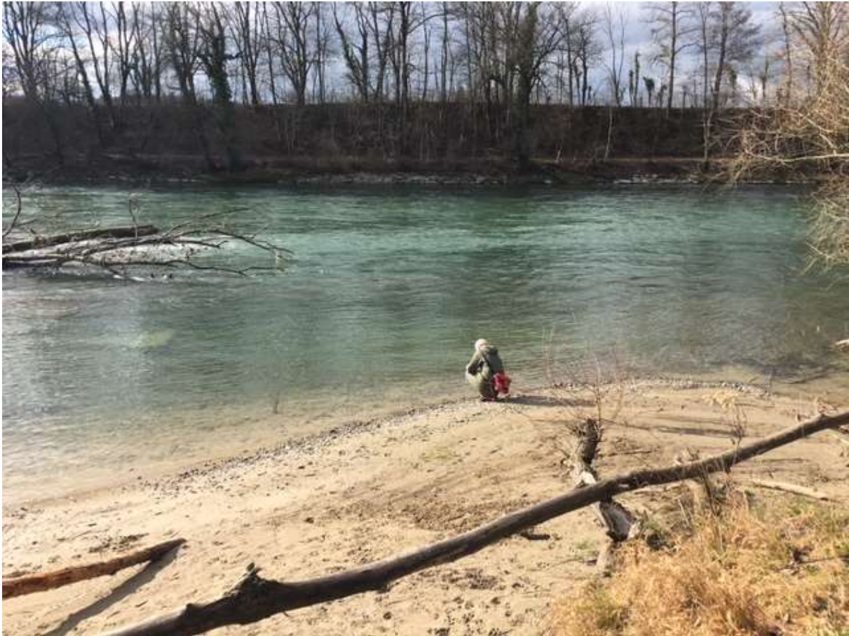
Idylle an der Reuss – aufgenommen im Januar.

Zum dritten Mal treffen wir uns zu einer leichten Wanderung von ungefähr zweieinhalb Stunden. Sie führt uns vom Kloster Gnadenthal bei Niederwil bis nach Bremgarten im Kanton Aargau. Der Weg führt meist flach entlang dem Flussufer. Je nach Witterung oder Wunsch können wir unterwegs picknicken oder am Schluss der Wanderung in einer Beiz in Bremgarten einkehren. Genaue Zeiten und weitere Details auf Anfrage.